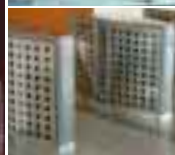
Скоростные турникеты со створками [Speed Gates]