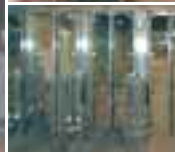
Однонаправленные турникеты [Anti-Return Gates]