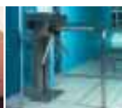
Трехштанговые турникеты [Tripod Turnstiles]