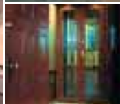
Шлюзовые тамбуры [Security Manlocks]