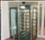
Полнопрофильные турникеты [Full Height Turnstiles]